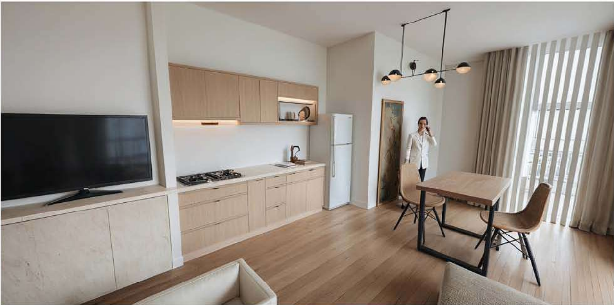
Planta Baja. Vivienda A