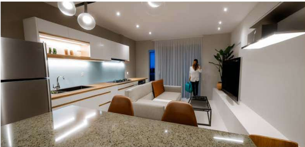
Planta Primera y segunda. Vivienda A