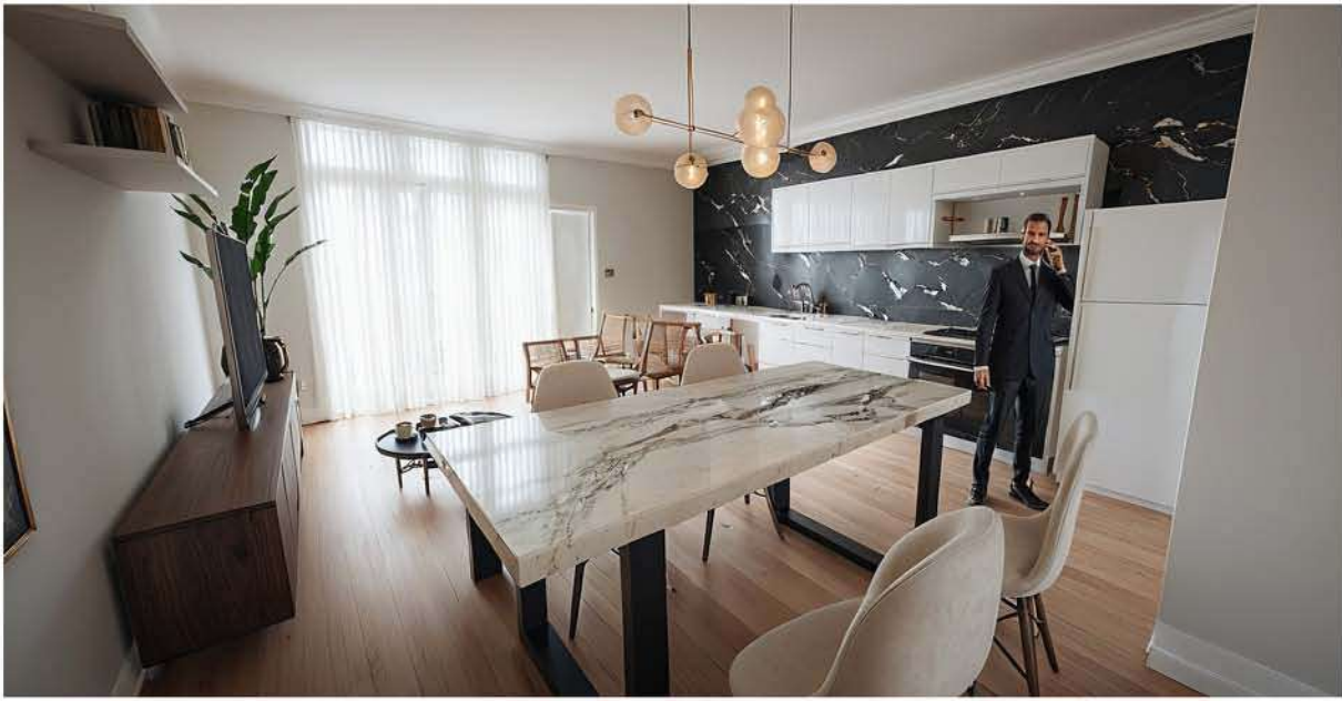
Planta Primera y Segunda. Estudio B