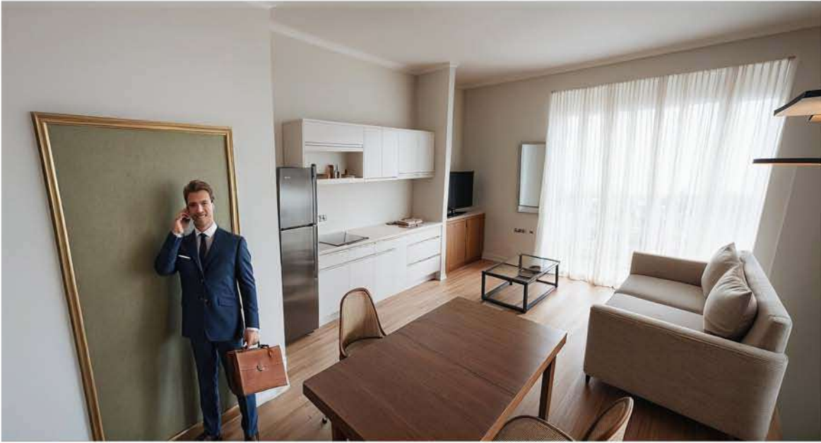
Planta Baja. Estudio B